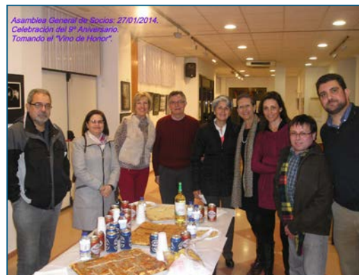
Asamblea General de Socios: 27/01/2014. Celebración del 9º Aniversario. Tomando el "Vino de Honor".