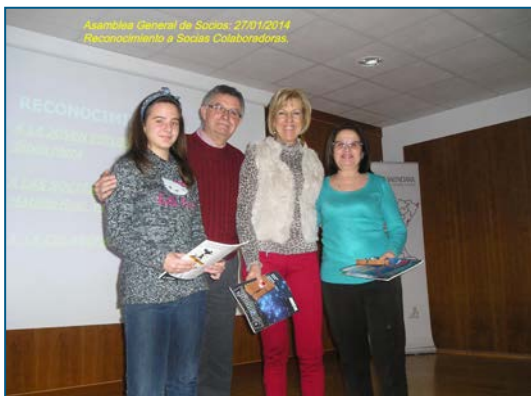
Asamblea General de Socios: 27/01/2014 Reconocimiento a Socias Colaboradoras.