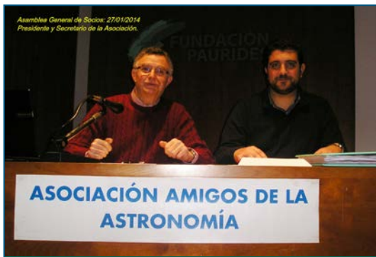
Asamblea General de Socios: 27/01/2014 Presidente y Secretario de la Asociación.

Celebramos el 9º aniversario de la Asociación tomando un vino de honor. Os ponemos unas fotos de recuerdo.