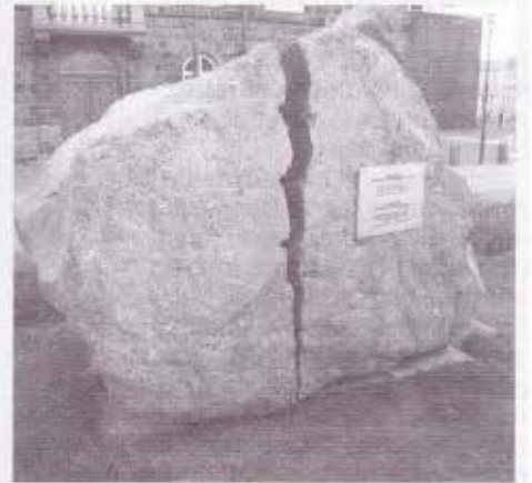
Monumento a la Desobediencia Civil

«Cuando el gobierno viola los derechos del pueblo la insurrección es para el pueblo, y para cada porción del pueblo, el más sagrado de sus derechos y el más indispensable de sus deberes». La cita, extraída de la Declaración de los Derechos del Hombre, de 1793, figura en el Monumento a la Desobediencia Civil : una escultura del español Santiago Sierra